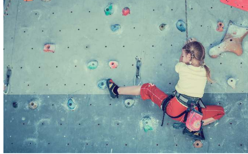
Formatieve assessment: laat iedere leerling stappen zetten in z'n leerproces.

Je kunt een algemeen oordeel vellen over de prestaties van leerlingen (bijvoorbeeld met cijfers of met goed-voldoende-onvoldoende), maar de vraag is: leren ze daar echt van? Zien ze wat ze de volgende keer anders kunnen doen? Dat is immers waar je op uit bent: je wilt dat ze verder komen in hun leerproces. Formatieve assessment is een krachtige manier om leerlingen daarbij te helpen.