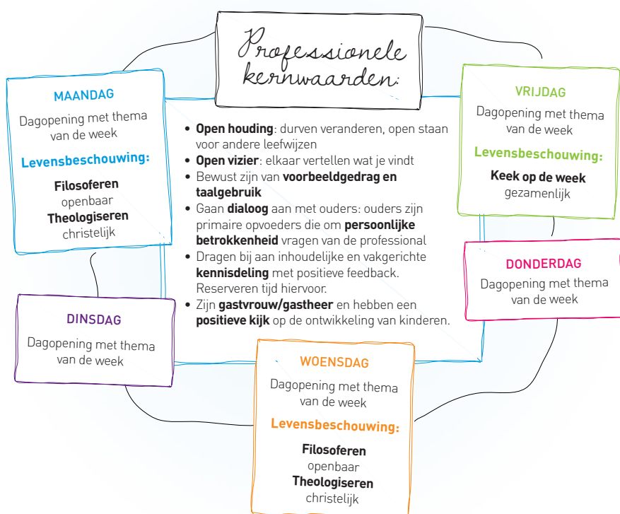
Schema 1 Ontmoetingsonderwijs op De Aventurijn

IKC De Aventurijn biedt vanaf augustus 2014 ontmoetingsonderwijs aan kinderen in de leeftijd van 0 tot en met 12 jaar. Kinderen van verschillende levensbeschouwelijke achtergrond ontmoeten elkaar om te spelen, te leren en om zichzelf te ontwikkelen. Het gaat daarbij om de totale ontwikkeling