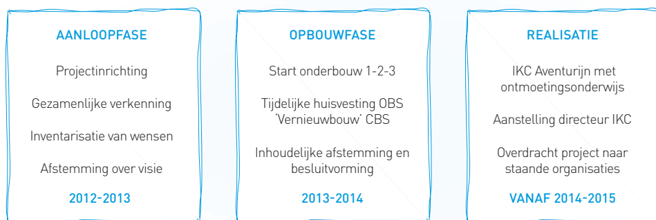
Schema 3 Fasering project IKC Aventurijn

fase' Schema 3). In de tussentijd is de werkgroep 'Inhoud' dit schooljaar al gestart met de inrichting van het ontmoetingsonderwijs in het bestaande schoolgebouw van OBS de Bijenburch. In de overgang tussen de bestaande en de nieuwe situatie wordt er momenteel in de groepen 1, 2 en 3 derhalve al vorm gegeven aan ontmoetingsonderwijs, vooruitlopend op een invulling voor het gehele team vanaf augustus 2014. Aangezien de ouders volop betrokken zijn bij de besluitvorming hierover, is dit voor niemand echt een verrassing.