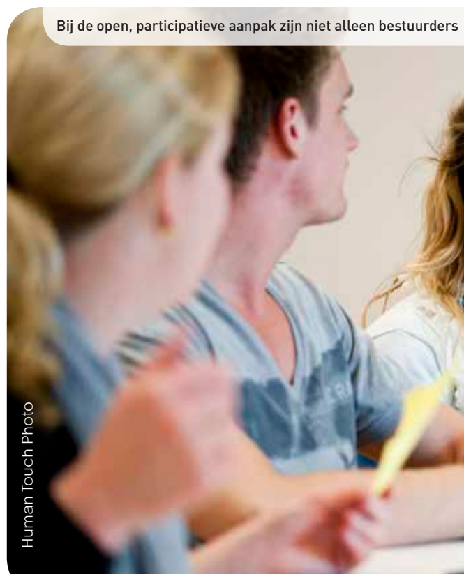
Human Touch Photo